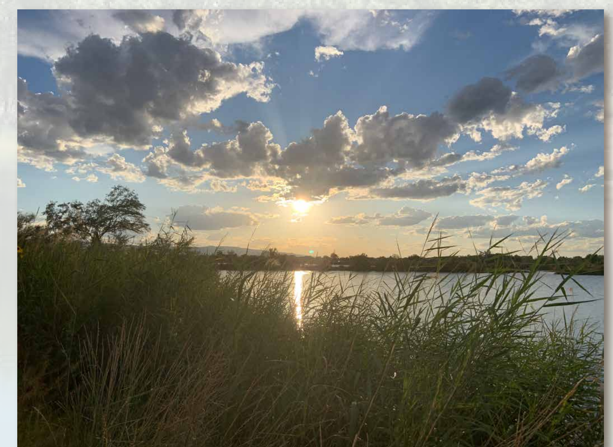
La zona de vida silvestre del Río Colorado se maneja en beneficio de la vida silvestre.