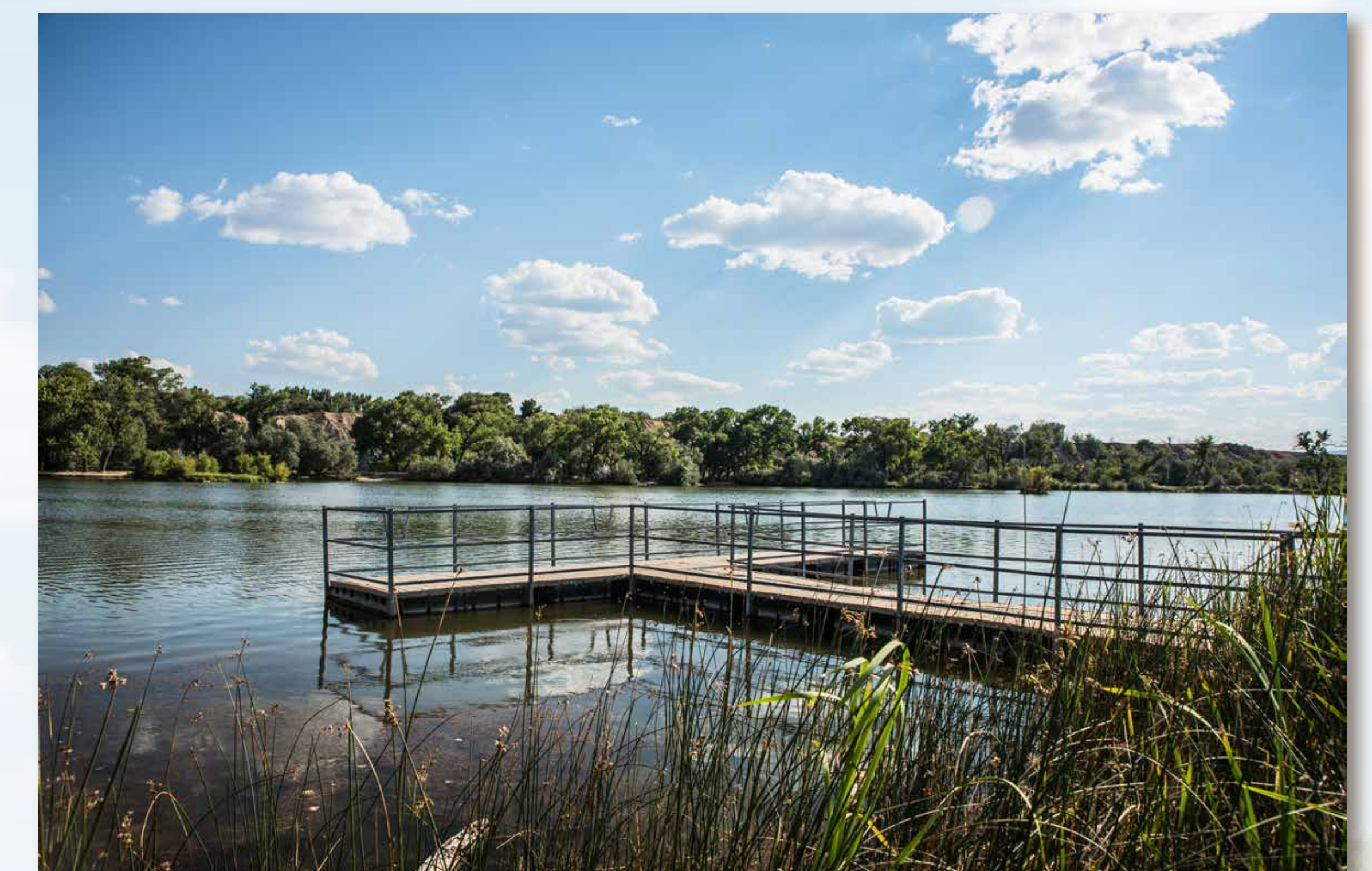
La sección Corn Lake ofrece pesca accesible y acceso céntrico al río.