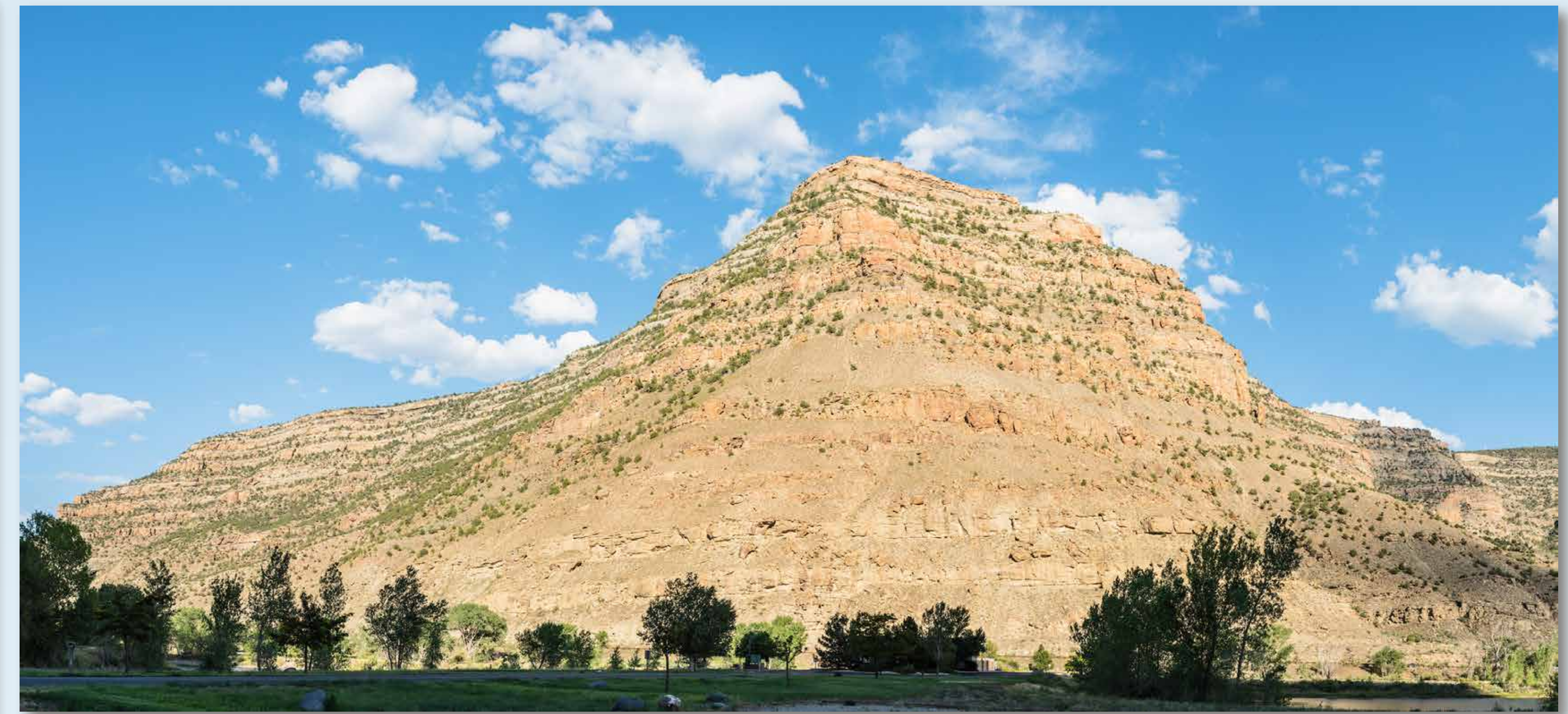
La sección Island Acres ofrece vistas del cañón, acampada y pesca de calidad durante todo el año.